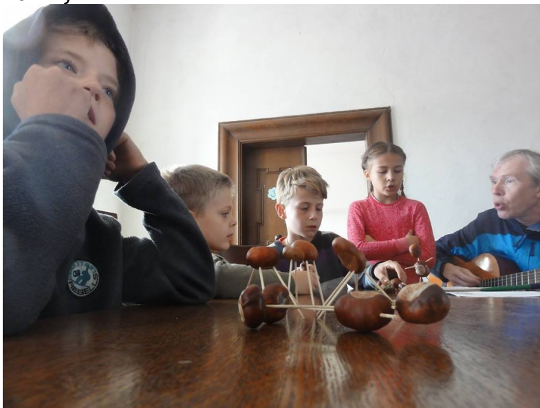
Sborový pobyt v Manětíně