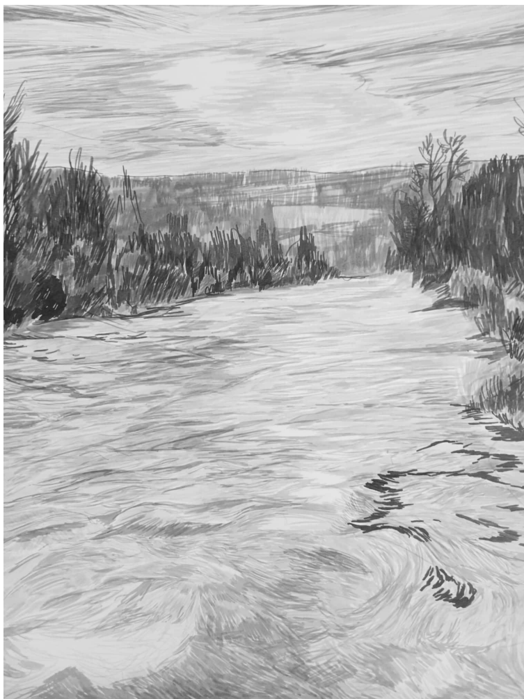
kresba Diana Živná

Mohlo by se ještě pokračovat. Ale zmíním poslední zkušenost, která mne fascinuje: Když máte za sebou celodenní túru, s výstupem a sestupem, druhý den se vám určitě nikam nechce a nohy necvičeného chodce bolí ještě týden, možná si spálíte i kůži od slunce nebo promoknete na kost. Ale stejně to brzy pomine – a brzy vám to nedá a jdete do toho znovu. Kéž takto po všech pádech, zraněních a nezdarech naší cesty za Kristem najdeme odvahu opět vykročit!