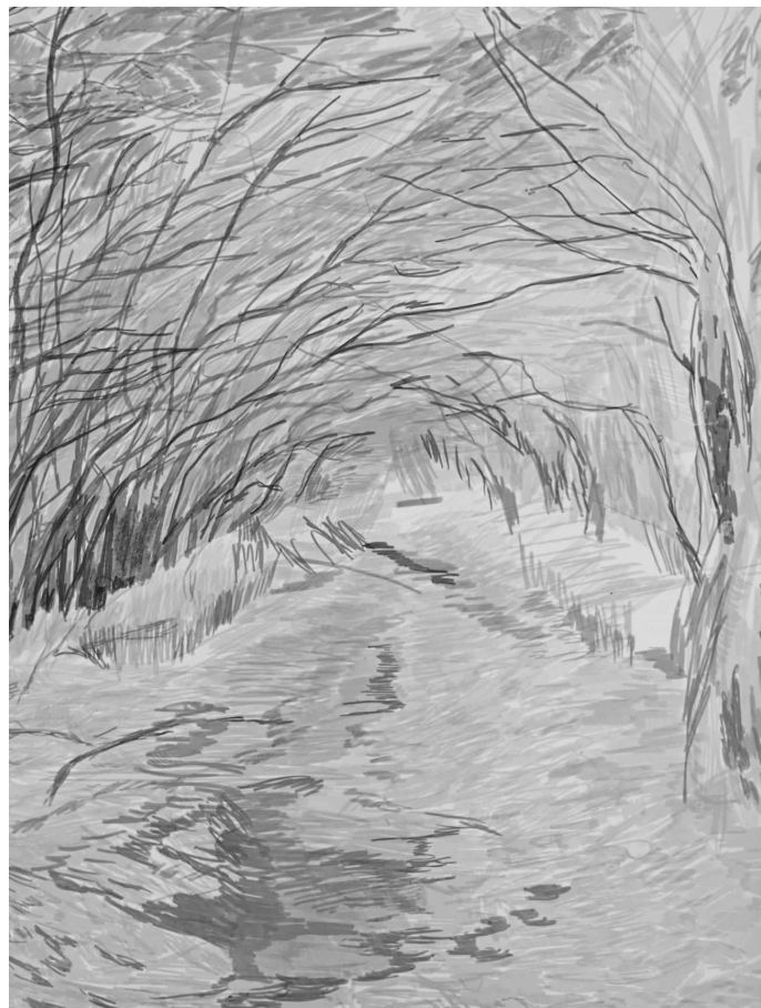
kresba Diana Živná